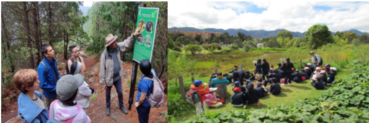
Caminatas ecológicas en el Distrito

Estos recorridos buscan fomentar una mayor conciencia ambiental y motivar en los participantes cambios actitudinales que contribuyan a la conservación del ambiente natural y los recursos que ofrece la ciudad. Las caminatas están dirigidas a la comunidad en general, así como a entidades e instituciones educativas, tanto públicas como privadas, y no tienen ningún costo para los participantes.